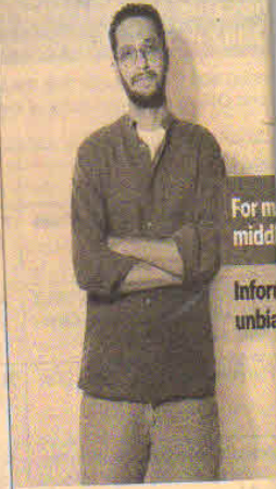
For m midd Infor unbia